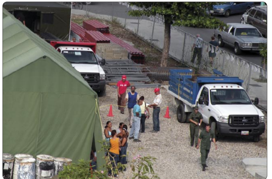
Aquí guardan los materiales de "Barrio Tricolor" para distribuir en los barrios de Chacao.