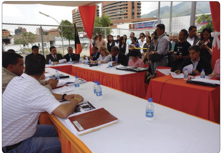
En nuestro Mercado Nuevo se hizo un Cabildo Abierto.

-Los medios de participación son: Iniciativa Popular, Cabildos Abiertos, Asambleas de Ciudadanos y Ciudadanas, Consultas Públicas, Presupuesto Participativo, Control Social, Referenda, Iniciativa Legislativa, Instancias de Atención Ciudadana, Autogestión y Cogestión, la Justicia de Paz, el Voluntariado, el Comité de Usuarios, Consejos Comunales, Asociaciones de Vecinos y demás organizaciones comunitarias.