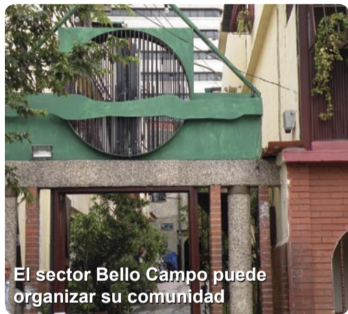
El sector Bello Campo puede organizar su comunidad