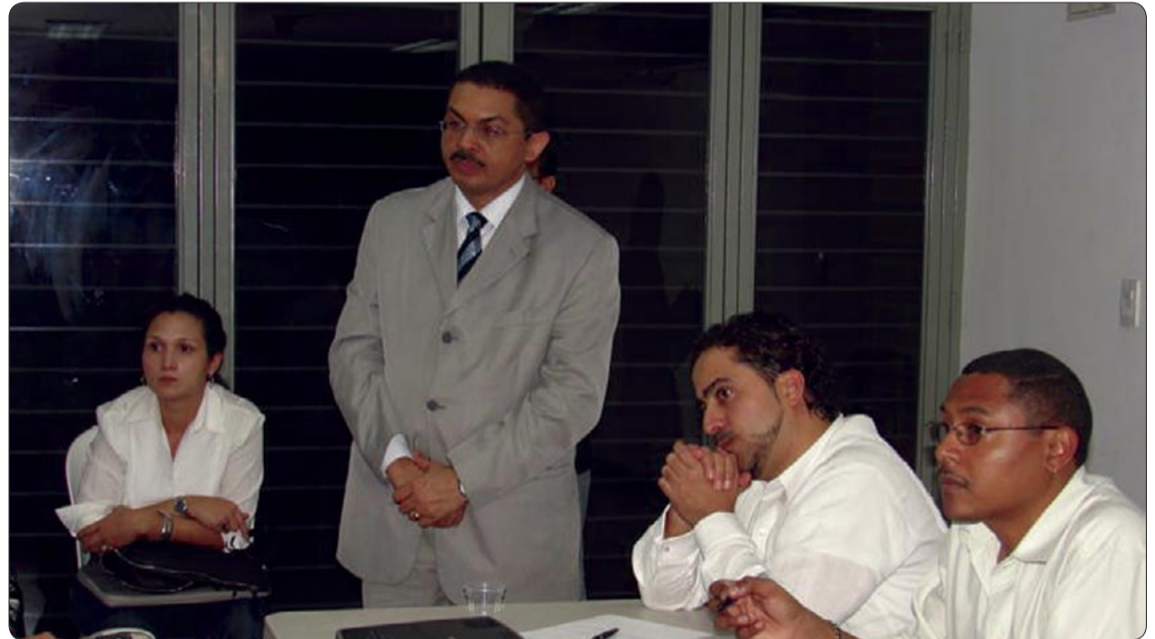
La Comisión de Hacienda impulsó actividades con las comunidades.

Los vecinos pudieron disfrutar de otras actividades extras a lo que es la formalidad del trabajo de la comunidad como fueron la tertulia con Francisco Suniaga y el recital a la Negra Mercedes (Mercedes Sosa).