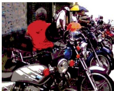
Los concejales acordaron normalizar la situación de los moto taxistas.