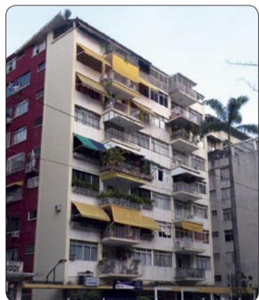
La Ordenanza de Inmuebles Urbanos establece cambios en la tabla de valores