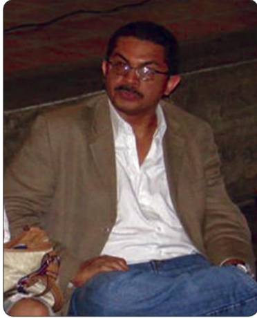
El Concejal Chirino impulsó varias ordenanzas tributarias.

En los últimos cuatro años la Comisión de Contraloría y Hacienda, a cargo del concejal Chirino, impulsó reformas y la creación de más de 20 normativas legales, todas orientadas a mejorar las condiciones de vida de los chacaoenses. Podríamos